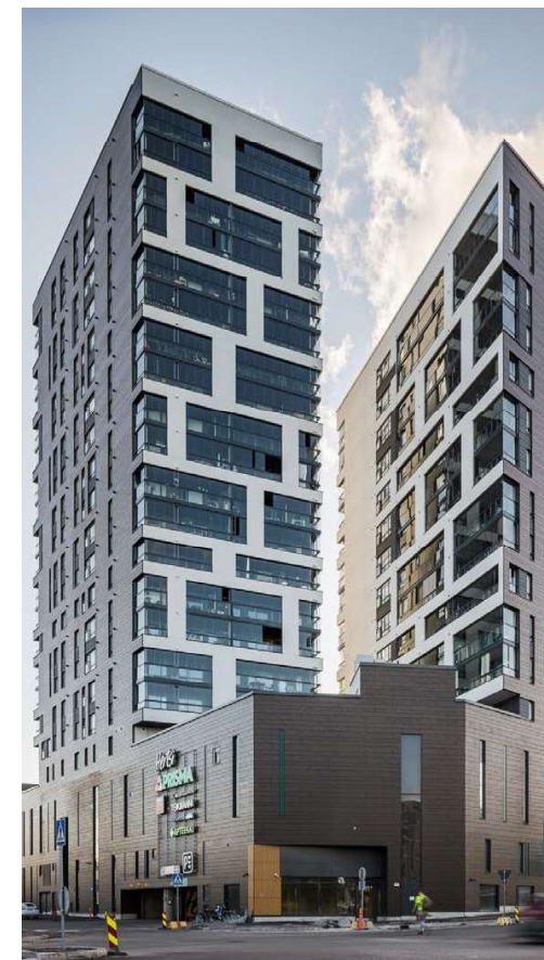
As Oy Helsingin Poudantuoja

* laskennallinen arvio perustuen rakentamis- ja ylläpitokustannuksiin (KTI-Rakli -vastuullisuusraportointisuositus)